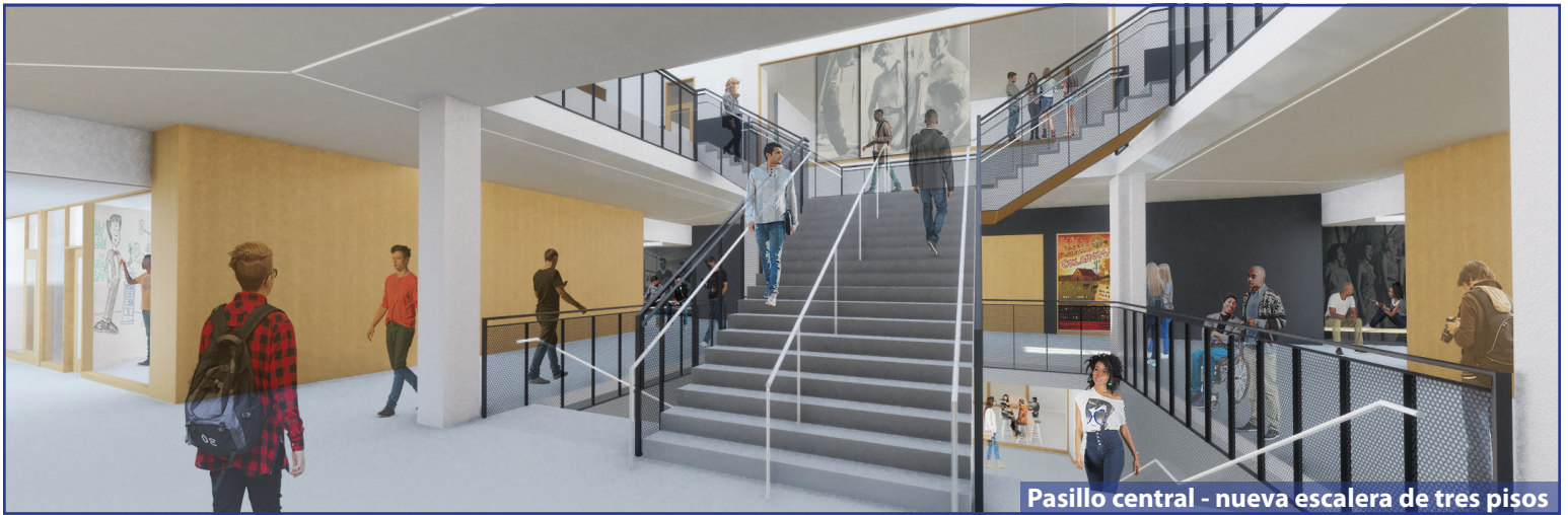
Pasillo central - nueva escalera de tres pisos

Una inversión de $158 millones en el noreste de Portland