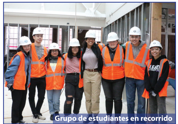
Grupo de estudiantes en recorrido

El campus de Grant seguirá siendo un sitio de construcción activa durante la mayor parte de el verano. Esto significa que muchas actividades deportivas de verano permanecerán en Marshall o van a tener lugar en otros sitios. Por favor consulte con sus entrenadores para determinar dónde practicará este verano.