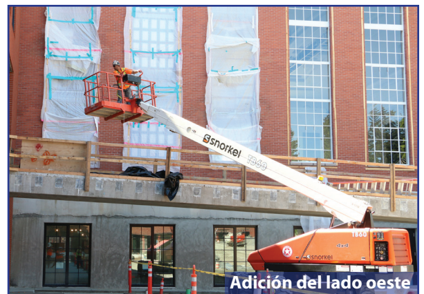
Adición del lado oeste